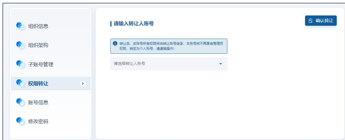
图 29 权限转让

如遇离职等需更换组织管理员的情况，需要原组织管理员权限转让给新的账号。转让后原账号变为个人账号权限，新账号变为组织管理员权限。转让的新账号需为注册且加入本组织的个人账号。