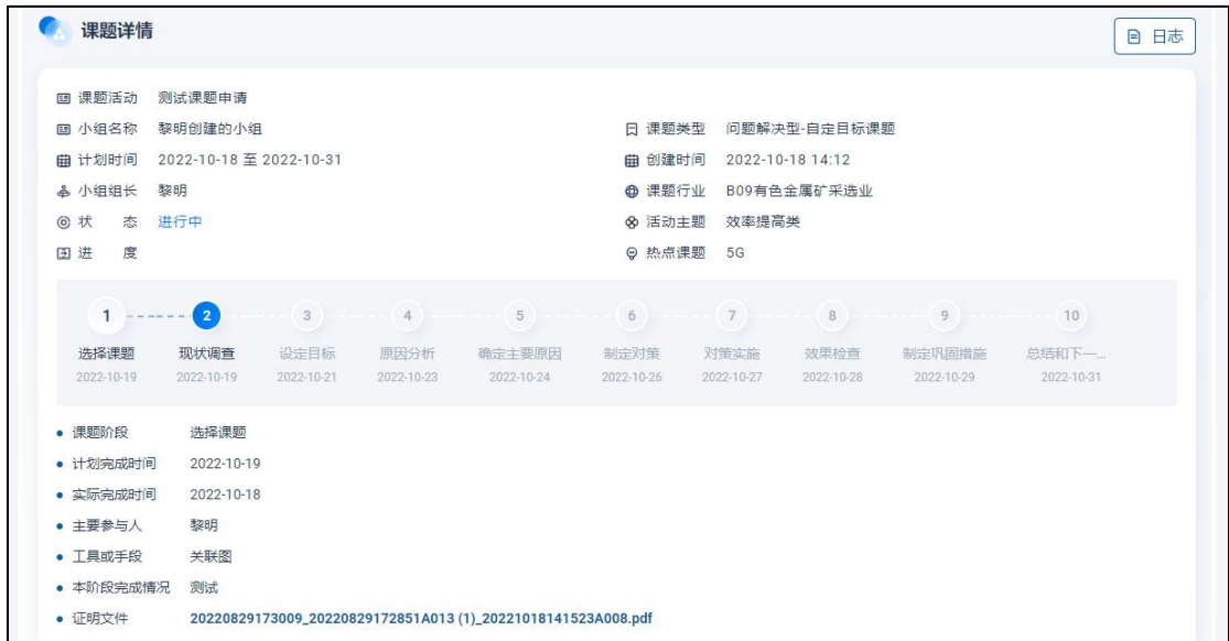
图 20 课题详情-组织管理员