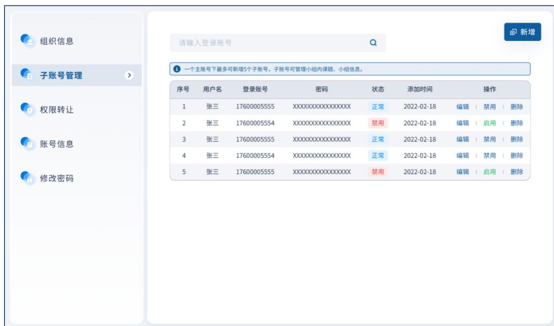
图 28 子账号管理

子账号可审批企业个人用户的课题申请、查看课题情况。但不可修改组织信息、组织架构、转让权限等。