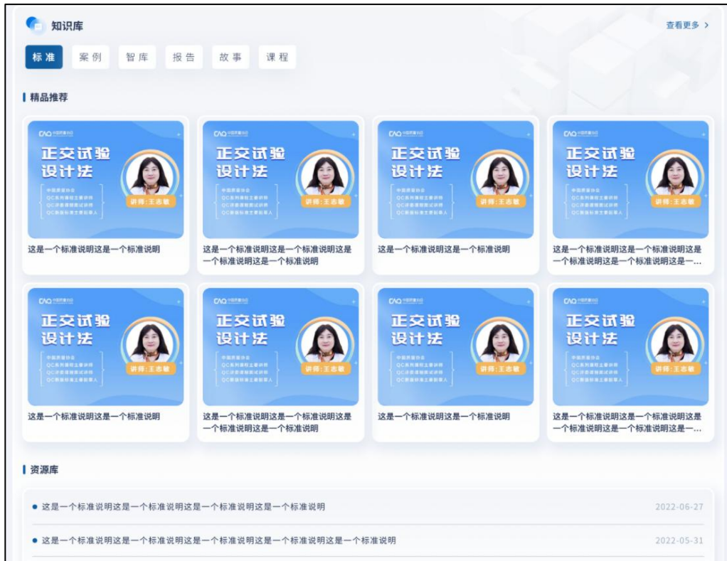
图 31 知识库

用户（个人用户和组织管理员均可）可在知识库模块查看质协发布的 QC 相关知识，管理办法，相关课程等。