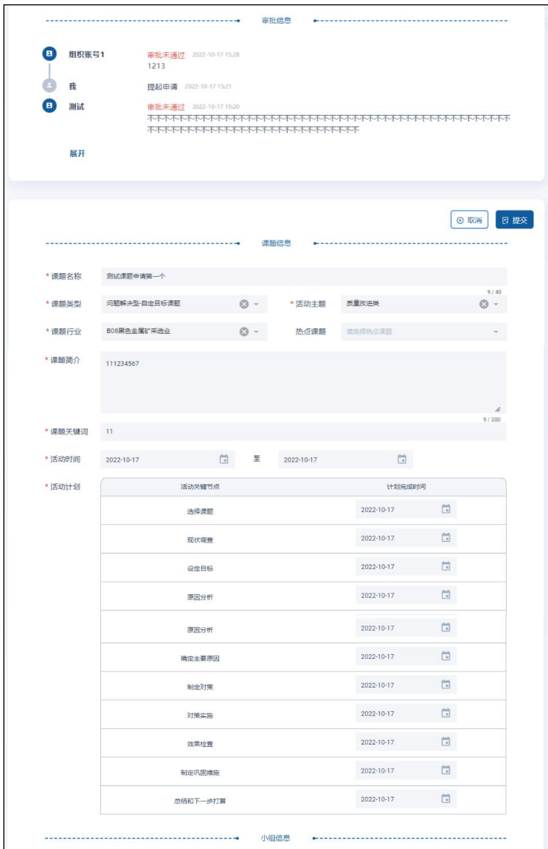
图 13 审批拒绝重新申请