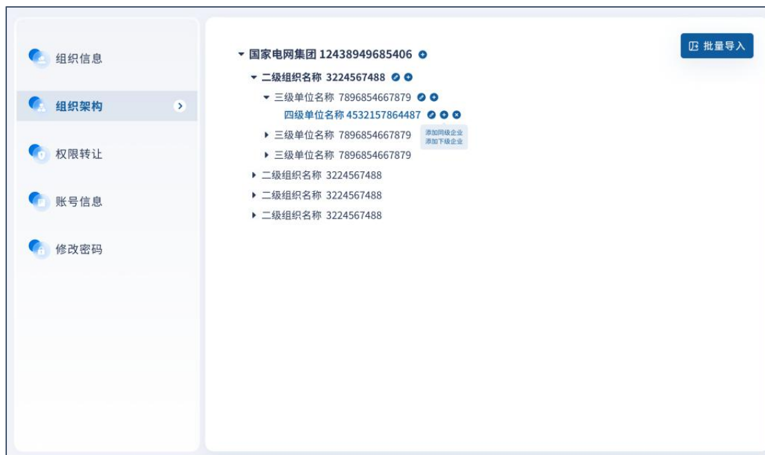
图 27 组织架构管理

平台将以社会信用代码为准，社会信用代码匹配到的企业可在 QC 服务功能下查看到本级及集团内下属企业的 QC 活动数据。请谨慎维护正确的组织信息，防止信息错误。