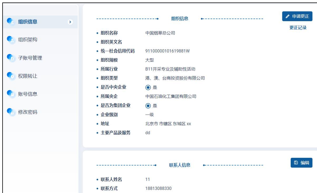
图 26 组织信息