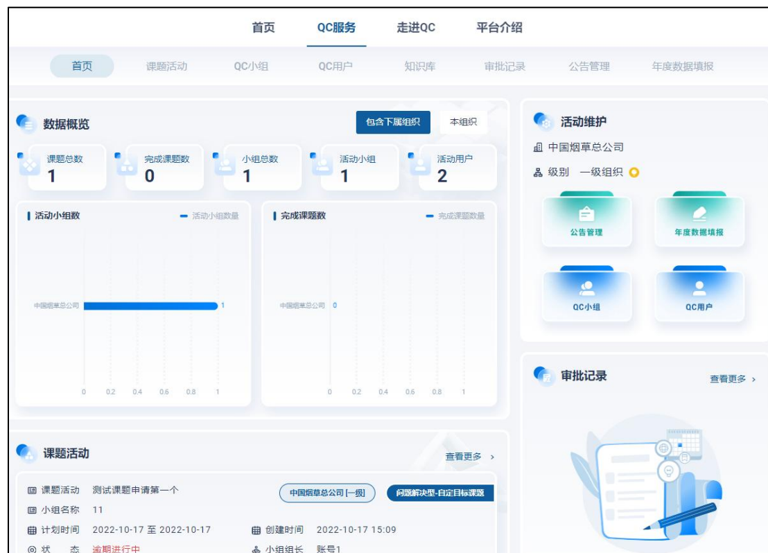
图 17QC 服务首页（组织管理员用户）

组织用户分为基层组织和上层组织，架构层级由各集团管理员维护。基层组织管理员可查看本企业数据，上层组织管理员可查看本企业及下属企业数据。