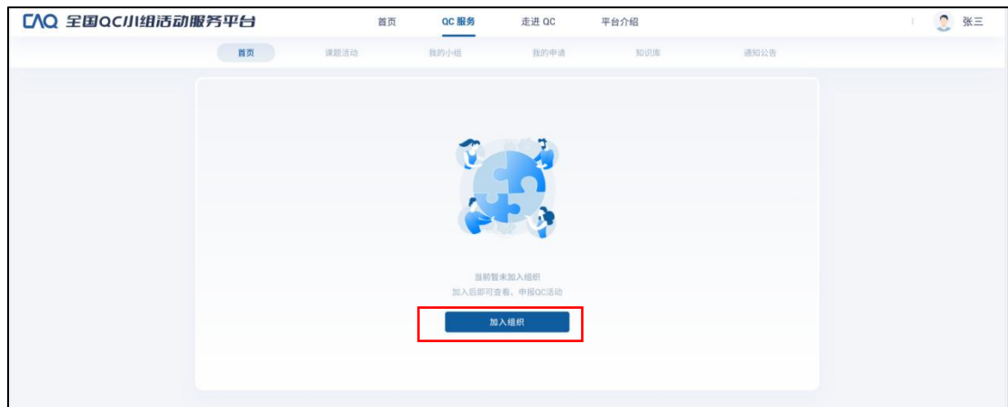
图 6 加入组织-步骤 1