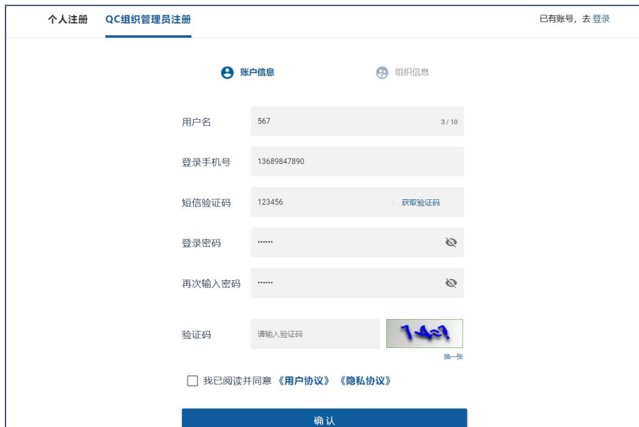
图 2QC 组织管理员注册-步骤 1