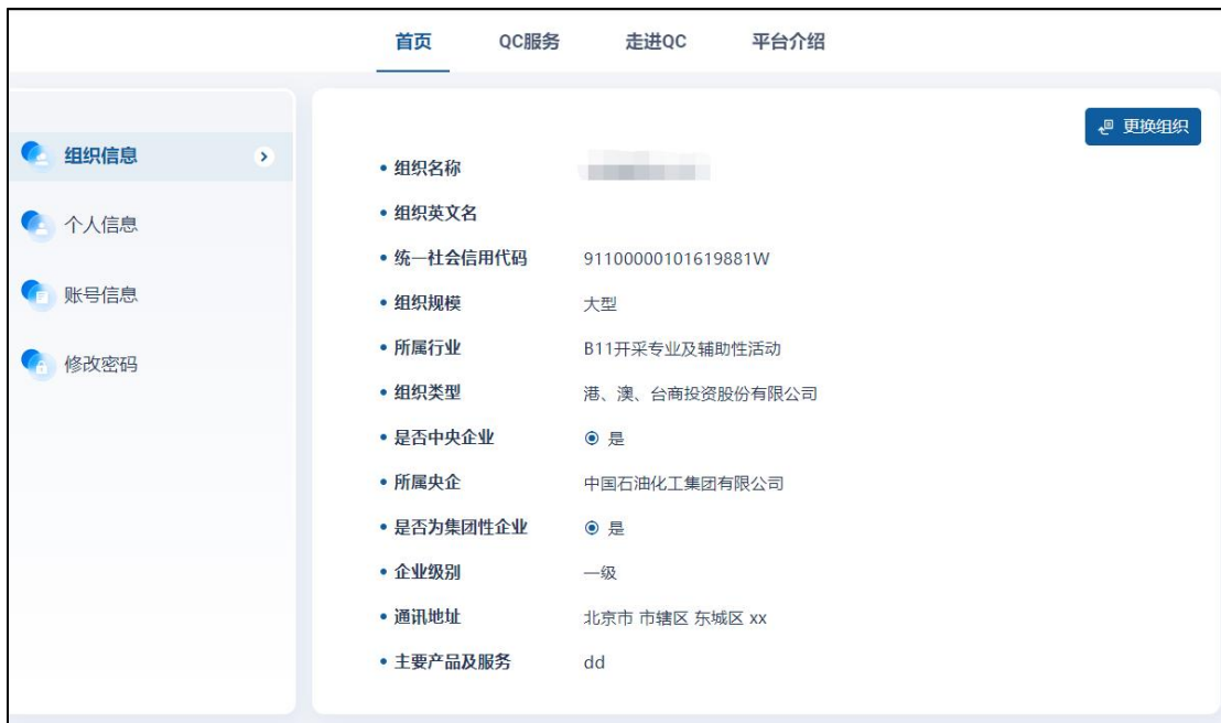
图 16 个人用户信息维护

个人用户可查看组织信息，更换绑定组织，修改个人信息、账号信息、修改密码等。 如更换组织，则后续的 QC 活动在新的企业组织下进行，原组织下 QC 活动不可见。