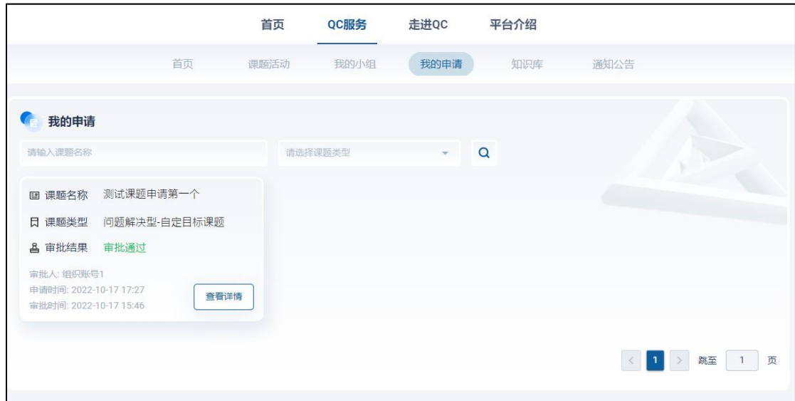
图 12 我的申请列表