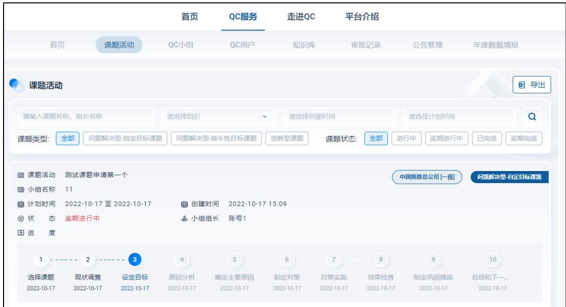
图 19 课题活动列表-组织管理员