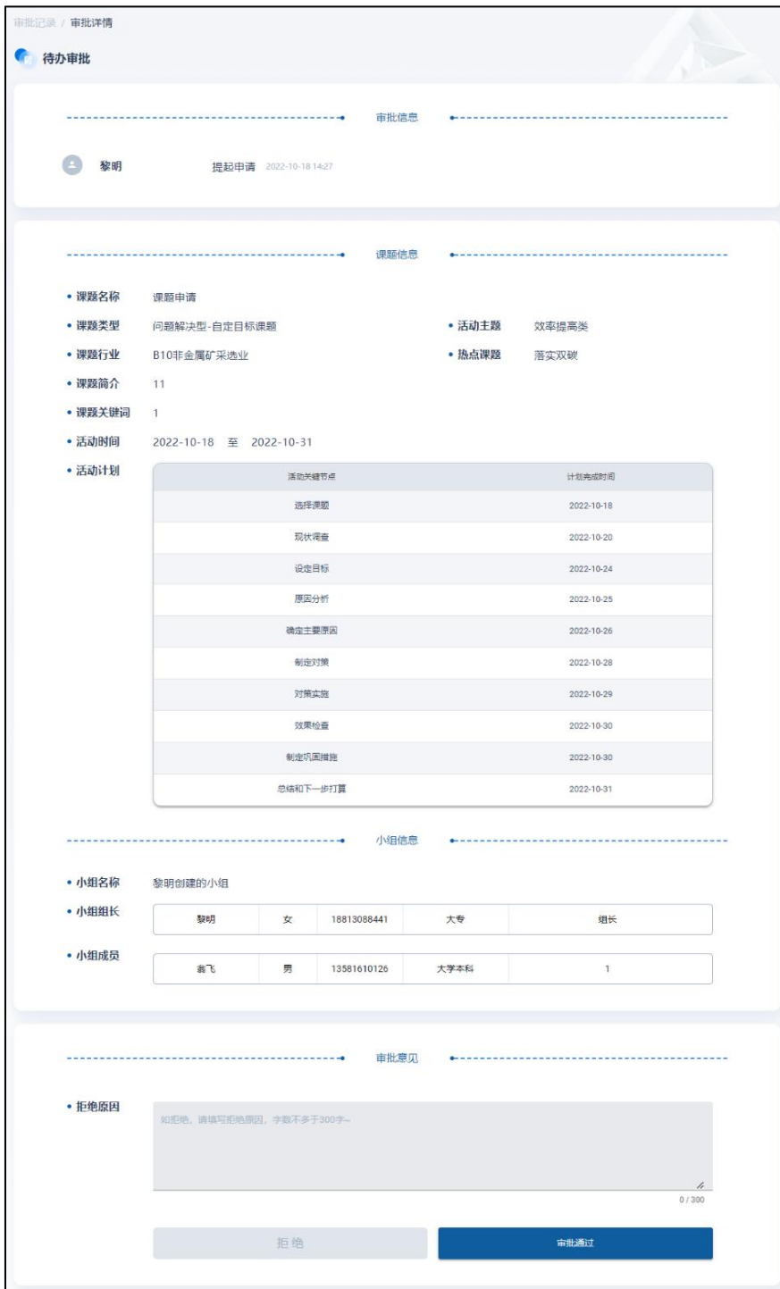
图 18 课题审批