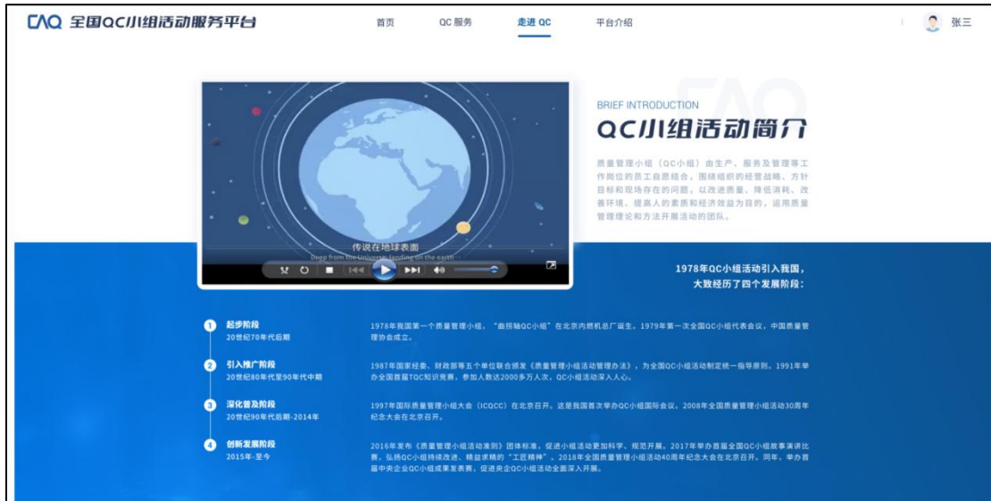
图 30 走进 QC