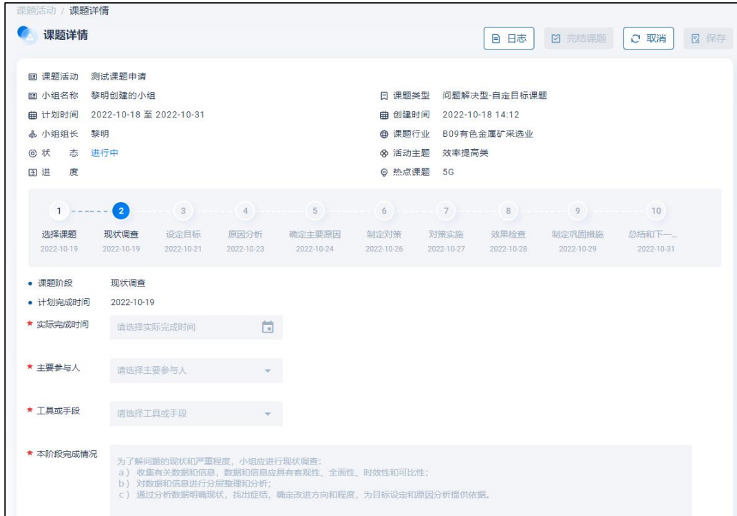
图 15 课题活动详情-编辑